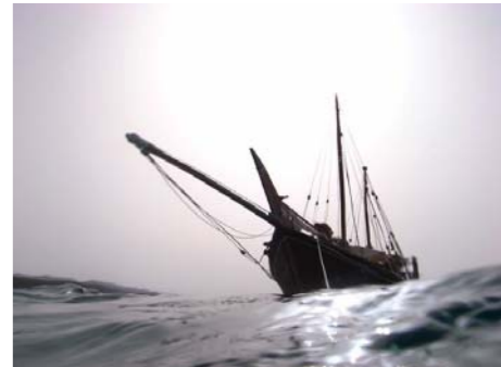
Un boutre nommé "NIZWA" Dans le sillage d'Henry de Monfreid

Ce film sera totalement libre de droit et nous pourrons l'utiliser à notre convenance, que ce soit pour diffusion au Musée ou même dans les diverses manifestations extérieures.