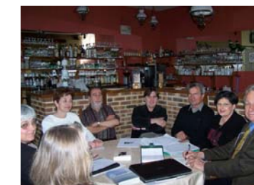
Photos prises lors de l'AG du 18 avril 2009