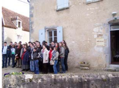
Mars 2009 La classe de français du lycée St Jean-de-Braye en visite au musée.

leurs correspondants Polonais, accompagnés des Professeurs et interprètes. La visite, finalisait le travail scolaire(ils avaient les uns et les autres étudié en classe, l'œuvre d'Henry de Monfreid).