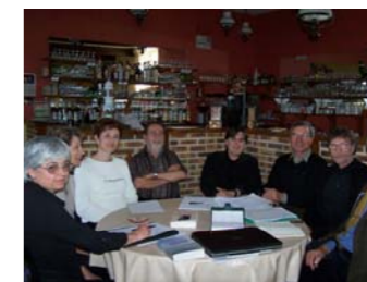
De gauche à droite :