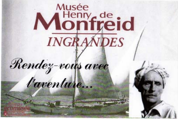
Panneau que vous rencontrerez désormais avant la déviation d'Ingrandes.

Depuis longtemps déjà, mais depuis l'année dernière de façon plus cruciale (à cause de la mise en service de la déviation routière), notre soucis majeur était de nous doter d'une bonne signalisation en direction du musée. La DDTE ayant finalement refusé de financer ce type de signalétique nous n'avons eu d'autre alternative que de financer, avec les fonds propres de l'association, la conception et la fabrication de panneaux routiers géants disposés sur des terrains privés aux entrées nord et sud de la déviation. Par ailleurs le Conseil Général nous a dotés de deux panneaux indicateurs mentionnant le musée.