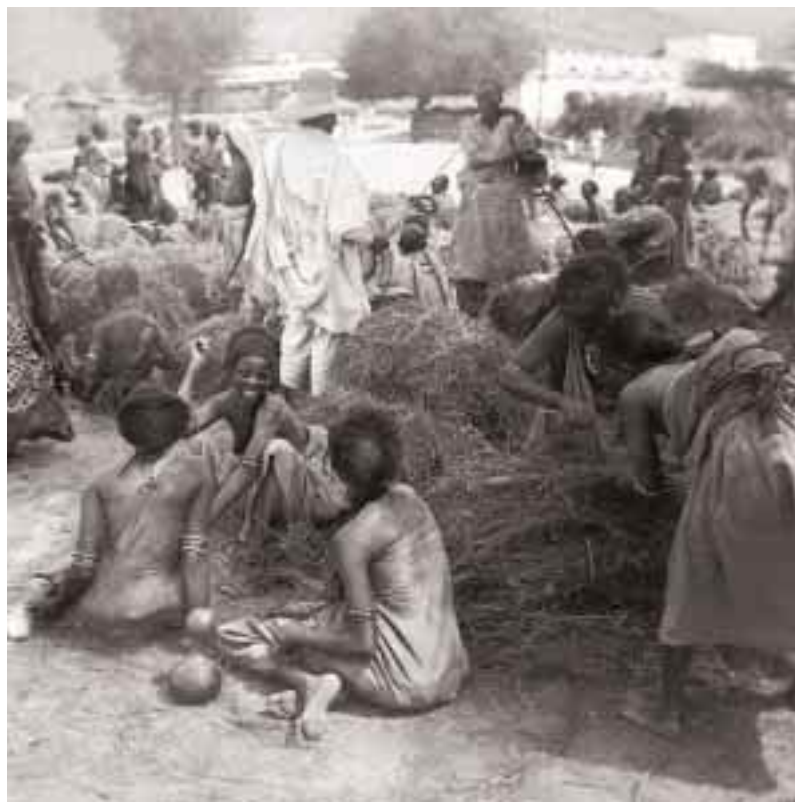
Le marché de Dire Daoua, vers 1912.