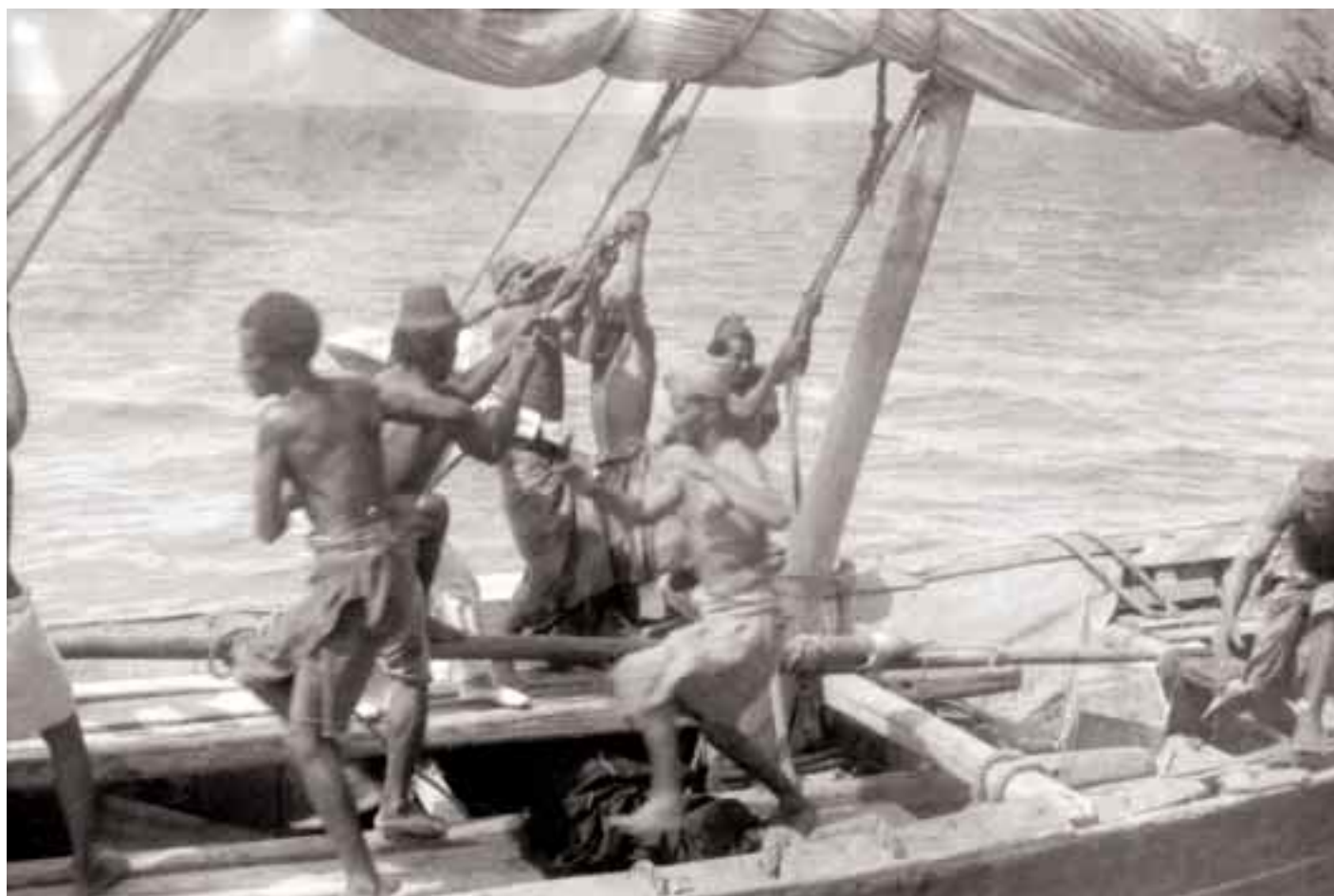
Manceuvre à bord d'un bouter en mer Rouge, vers 1935.